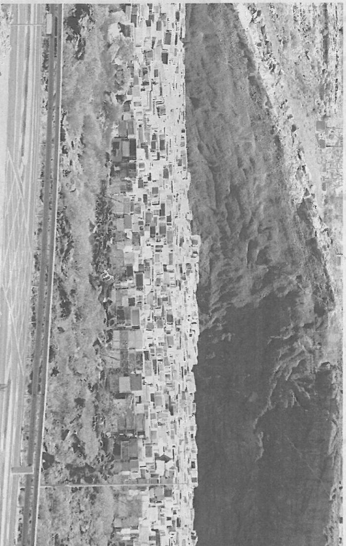
Frigoríficos almacenados en el Complejo Ambiental, a la espera de que comience a funcionar Ewaste.

Una vez esté Ewaste a pleno rendimiento, se prevé que pueda reciclar al menos 120.000 frigoríficos al año, a los que se sumará cualquier tipo de aparato electrónico. Bustabab aclara que según datos nacionales, al año se producen 18 kilos de residuos eléctricos por persona "y si tenemos en cuenta que la población de Canarias es de 2,5 millones de